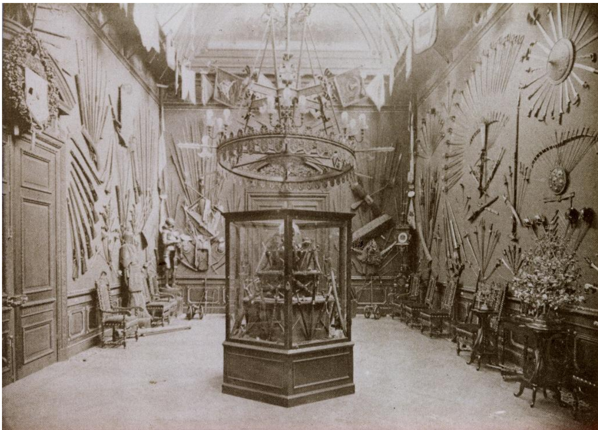
Afb. 1. Wapenzaal in Paleis Het Loo, ca. 1910. Paleis Het Loo, Apeldoorn, RL4269.

Tijdens de regering van Willem III vonden in Nederlands-Indië tal van militaire (straf)expedities en oorlogen plaats, gericht op verdere territoriale uitbreiding. Dat koloniale ambtenaren en legerofficieren objecten uit de gebieden waarin zij actief waren aan de Koning schonken als teken van loyaliteit en ijver, is ook gebleken uit archiefmateriaal gevonden in het Koninklijk Huisarchief.