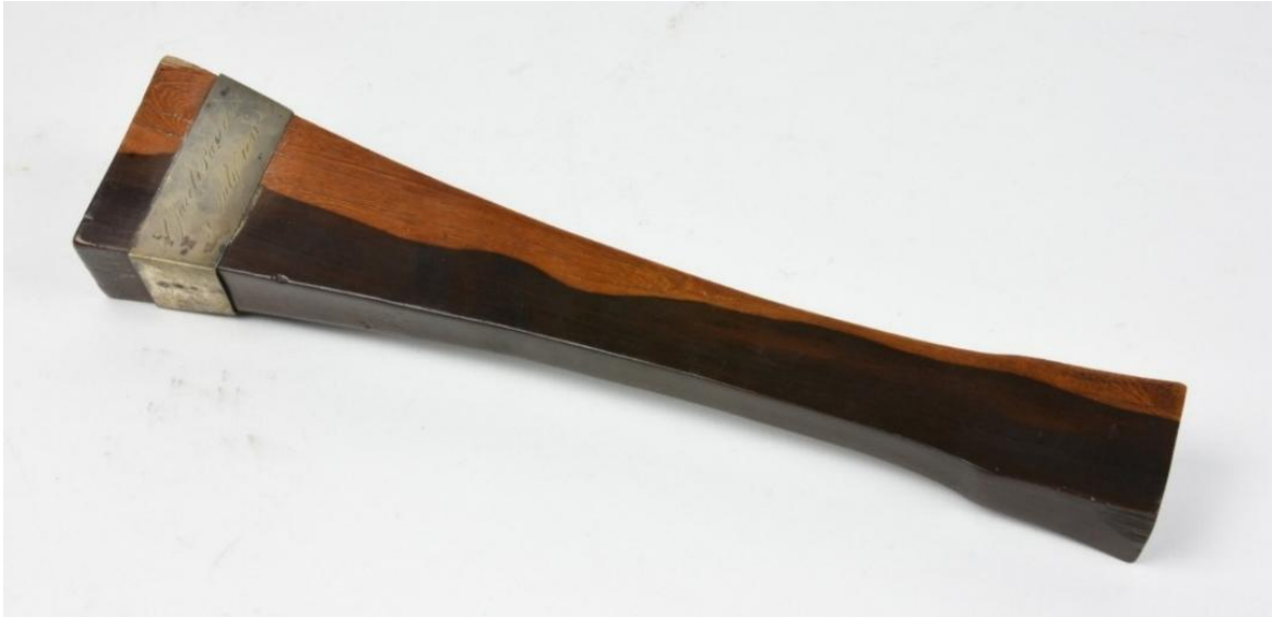
Afb. 15. Slaghout , geschenk aan Prins Alexander in 1841. Koninklijke Verzamelingen, Den Haag, MU-0653.