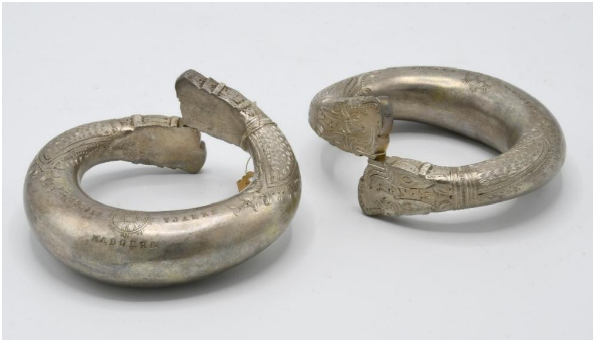
Afb. 12. Twee zilveren enkelringen, geschenk van het Korps Barisan Tjakra Madoera aan Wilhelmina ter gelegenheid van haar 50-jarig regeringsjubileum. Koninklijke Verzamelingen, Den Haag, MU-5451.

De uiteindelijke audiëntie vond plaats in september 1949 in het Koninklijk Paleis op de Dam. Wilhelmina, inmiddels prinses, zou hebben aangegeven het zeer op prijs te stellen het geschenk in ontvangst te nemen. Het is aannemelijk dat dit het laatste militaire geschenk is dat haar werd aangeboden, nog in haar hoedanigheid als Koningin. Opmerkelijk is dat zij koos voor een audiëntie in Amsterdam, en niet op Paleis Het Loo waar zij sinds haar aftreden verbleef. Dat duidt erop dat zij het aannemen van dit militaire geschenk een officieel karakter wilde geven.