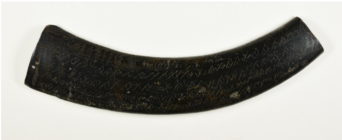
Afb. 3. Handschrift op halve buffelhoorn, geschenk van J.F.R.S. van den Bossche aan Koning Willem III. NL-HaKV, G013-2.

Twee bijzondere objecten uit de schenking van Van den Bossche, teruggevonden in het archief van de Koninklijke Verzamelingen, betreffen handschriften op twee halve buffelhoorns, waarvan één in Lampung-schrift en de ander in Rencong-schrift [afb. 3]. 23 Volgens de inventaris bevatten de hoorns een overeenkomst over de verdeling van een grens tussen twee districten, en waren deze – ten tijde van schenken – al meer dan 200 jaar oud. 24