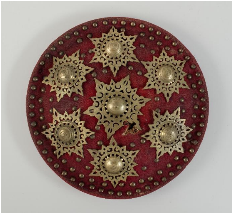
Afb. 4. Rond schild ( Périsè awi ) uit Atjeh, geschenk aan Koning Willem III. Koninklijke Verzamelingen, Den Haag, HTB-171 (in bruikleen aan Nationaal Militair Museum).