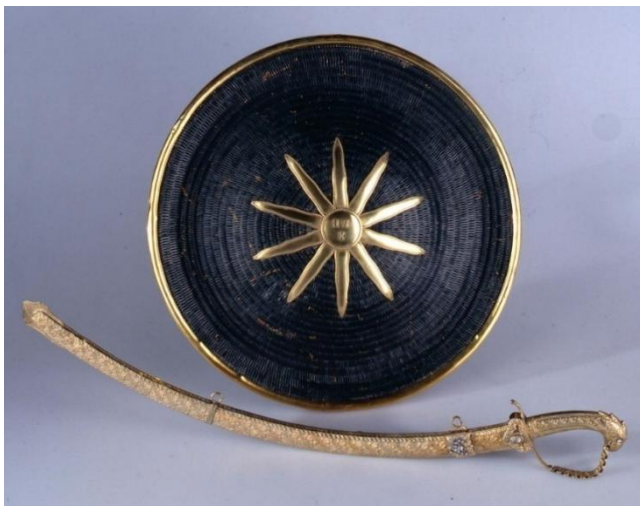
Afb. 8. Indonesisch schild met sabel , geschenk van de Susuhunan van Surakarta, Paku Buwono X, aan Koningin Wilhelmina ter gelegenheid van haar inhuldiging in 1898. Koninklijke Verzamelingen, Den Haag, MU-3900 (oud nummer HTB-604).

Daartegenover staat dat er in sommige gevallen langdurige persoonlijke relaties tussen Indonesische vorsten en het Nederlandse koningshuis werden opgebouwd. Dit geldt bij voorbeeld voor Paku Buwono X (1866-1939), die van 1893 tot zijn dood regeerde als Susuhunan of Keizer van Surakarta, een functie die weliswaar slechts een beperkte macht, maar wel veel aanzien en gezag gaf. Zijn streven naar een bijzondere relatie met Koningin Wilhelmina kan als een onderdeel van zijn politiek worden gezien. 47 Al bij haar inhuldiging in 1898 zond de Susuhunan Wilhelmina een aantal zeer kostbare gouden geschenken en ter gelegenheid van haar huwelijk in 1901 volgden gouden replica’s van een deel van zijn vorstelijke sieraden [afb. 8]. 48 Bij het regeringsjubileum van 1923 schonk Paku Buwono X een geheel ander cadeau, namelijk een schrijftafel met het rijkswapen van Surakarta met daarboven de Nederlandse kroon, een bijpassende bureaustoel en een zilveren schrijftafelgarnituur. Daarnaast schonk hij drie geschilderde en in djatihouten lijsten gestoken portretten van de Susuhunan zelf en van zijn oudste en jongste echtgenote. 49 Ook bij het huwelijk van Prinses Juliana en Prins Bernhard in 1937 ontbrak Paku Buwono X niet in de rij van schenkers.