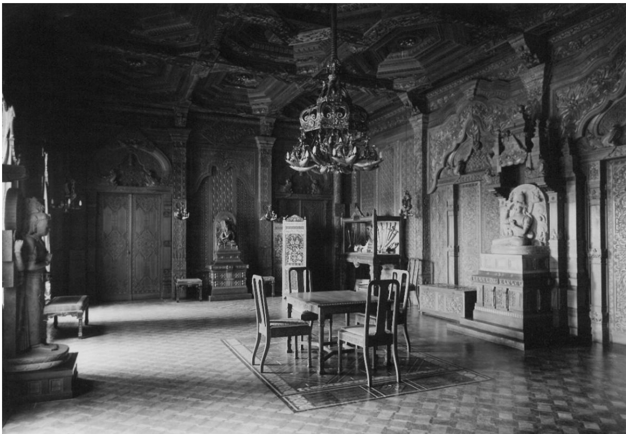
Afb. 10. Indische Zaal in Paleis Noordeinde , 1923. Fotografie: J. Bockstart. Koninklijke Verzamelingen, Den Haag, FO-0000636.

Naast de geschenken van Indonesische vorsten en Nederlandse ambtenaren zijn er gedurende de regeerperiode van Wilhelmina ook voorbeelden van geschenken die voortkwamen uit inzamelingen onder specifieke bevolkingsgroepen of zelfs onder de gehele bevolking. Het meest spectaculaire voorbeeld van het laatste is de Indische Zaal, die gefinancierd werd uit een brede geldinzameling onder de bevolking van Nederlands-Indië [afb. 10]. 62 Ondanks het uitgangspunt dat het een geschenk van de gehele bevolking zou zijn, is het duidelijk dat het vooral de koloniale en inheemse elites waren die een bijdrage leverden. 63 Opvallend is dat er voorzorgsmaatregelen werden genomen om te voorkomen dat mensen zich gedwongen voelden om bij te dragen en dat er zelfs maar een indruk zou kunnen ontstaan dat er enige dwang werd uitgeoefend.