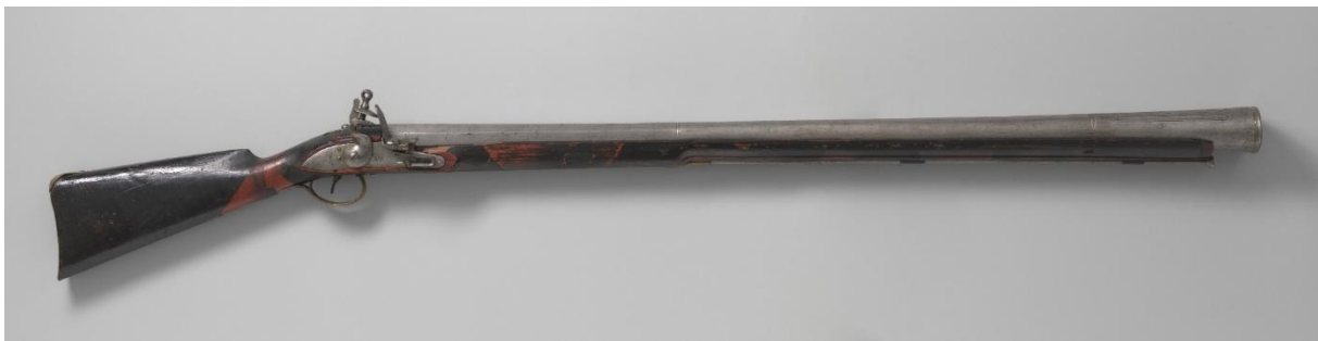
Afb. 2. Donderbus van Raden Intan, geschenk aan Koning Willem III in 1856. Koninklijke Verzamelingen, Den Haag, HTB-055 (in bruikleen aan Museum Bronbeek).

Op 16 augustus 1856 werd de aanval begonnen. In de inventaris wordt beschreven hoe Raden Intan op 9 september 1856 de kampong Djattie moest ontvluchten, waarbij hij al zijn wapens achterliet, inclusief de betreffende donderbus en twee klewangs. 16 Op 5 oktober 1856 werd Raden Intan door zijn met de Nederlandse troepen samenwerkende oom Raden Ngerapat verraden en vervolgens door Nederlandse militairen gedood. 17 Op voorstel van de legercommandant werden de buitgemaakte wapens aan Koning Willem III aangeboden. 18