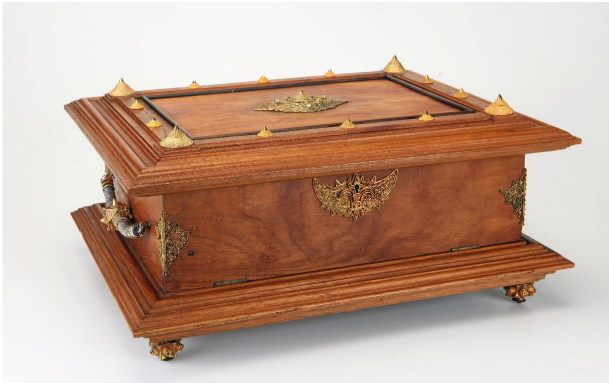
Afb. 11. Kist Van Heutsz , geschonken door J.B. van Heutsz aan Koningin Wilhelmina in 1904. Koninklijke Verzamelingen, Den Haag, FA-0736.

Op een van de foto's, getiteld 'Atjehsche goudsmiden', lijkt zichtbaar hoe enkele ornamenten waarmee de kist is versierd, worden vervaardigd. De ornamenten betreffen sieraden die in Atjeh door mannen en vrouwen werden gedragen. Op een andere foto, waarop de kist zelf is afgebeeld, wordt toegelicht wat de verschillende benamingen van de sieraden zijn en hoe deze werden gedragen.