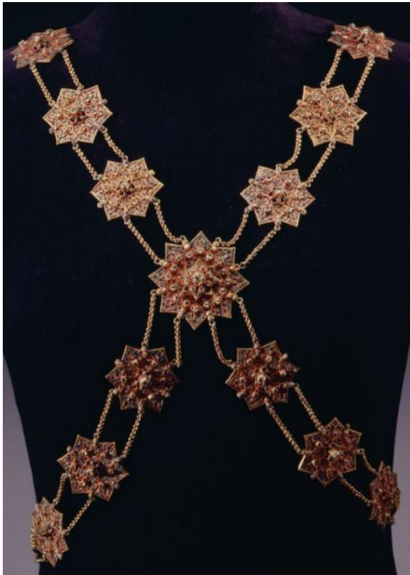
Afb. 6. Amuletketting (Simplah) , geschenk van de districtshoofden van Pidië en Meureudoe (Atjeh) voor de geboorte van Juliana in 1909. Koninklijke Verzamelingen, Den Haag, MU-3639.

het einde van de Atjeh-oorlog nog niet bereikt. Ook in de jaren die volgden was er sprake van militaire acties en verzet, onder andere in het regentschap Pidië. 42 De Noord-Brabanter berichtte op 4 augustus 1909 dat hoewel Koningin Wilhelmina in principe geen persoonlijke geschenken meer aannam, zij had besloten ‘dit treffend blijk van belangstelling’, uit een gebied dat ‘kortgeleden ons nog weinig gezind’ was, toch te aanvaarden. 43 Het geschenk werd vergezeld door een brief met een zeer onderdanige toon. 44 De opeenvolging van vijandelijkheden en dit gebaar van de districtshoofden zaaien sterke twijfel over de vrijwilligheid van dit geschenk.