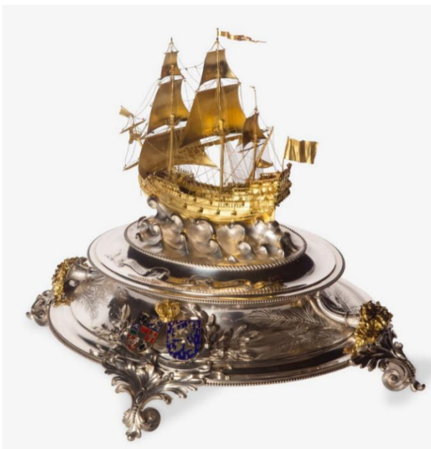
Afb. 14. Tafelstuk van galjoen op zee , geschenk van de bevolking van Suriname voor Wilhelmina en Hendrik ter gelegenheid van hun huwelijk in 1901. Koninklijke Verzamelingen, Den Haag, MU-4467.